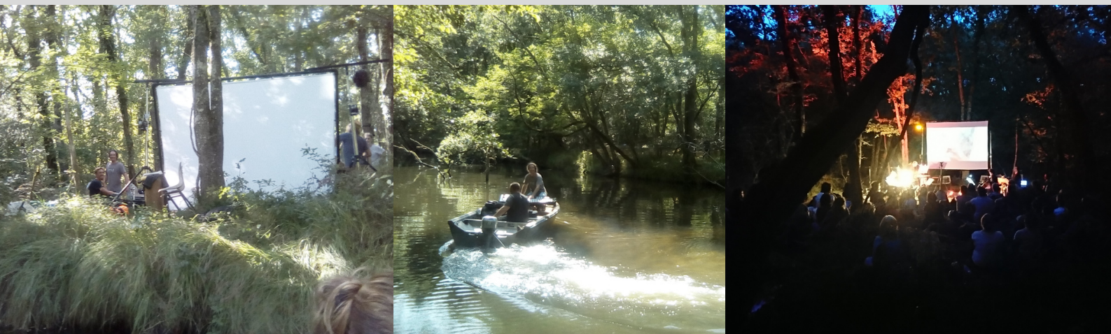
Installation UNDA - ENS Bernos Beaulac arrivée en canoé du public et ballade naturaliste